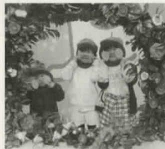
なりきり!ののぶん♪