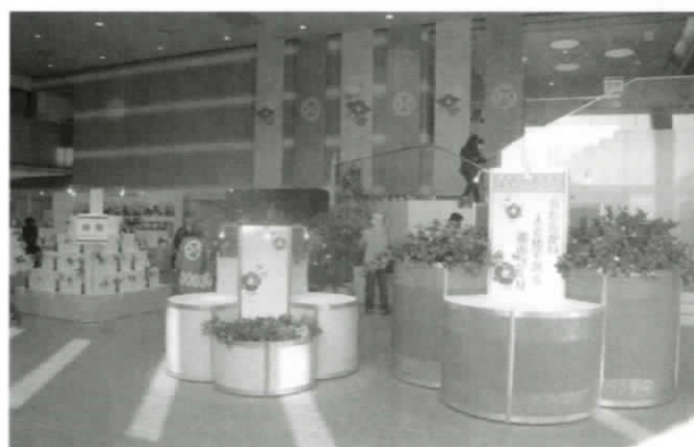
椿まつりシンボルモニュメント