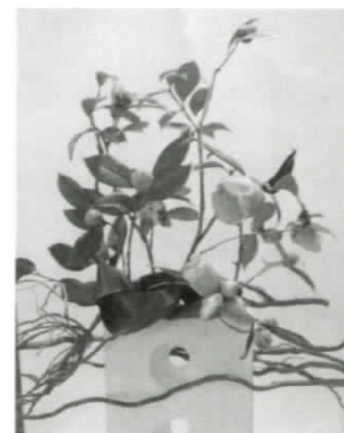
アートオブツバキ