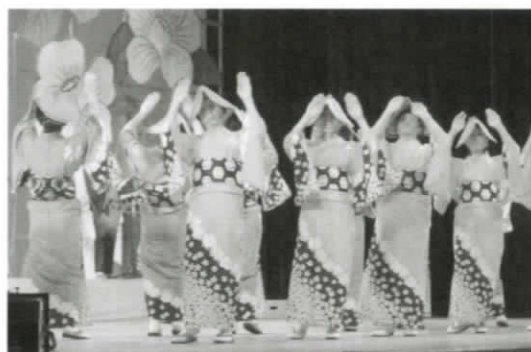
賑やかなステージ