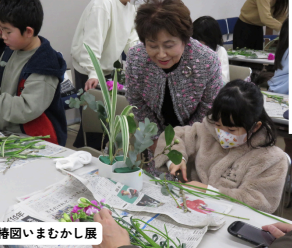
百椿園いまむかし展