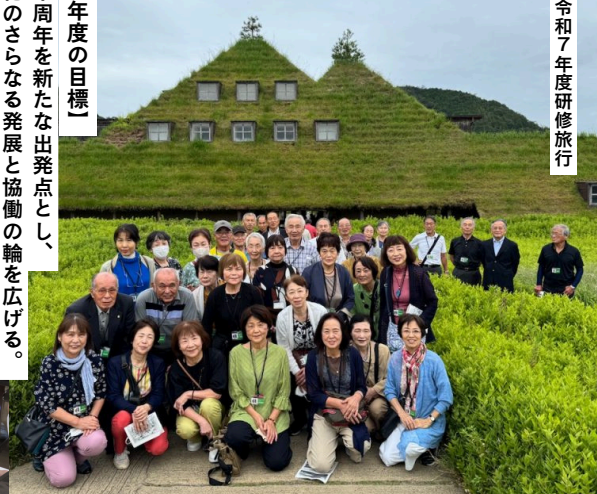
令和7年度研修旅行

「令和8年度の目標」 創立四十周年を新たな出発点とし、地域文化のさらなる発展と協働の輪を広げる。