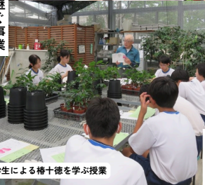
中学生による椿十徳を学ぶ授業