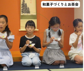
和菓子づくりとお茶会